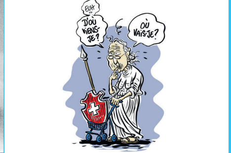
Neuchâtel - Le Musée